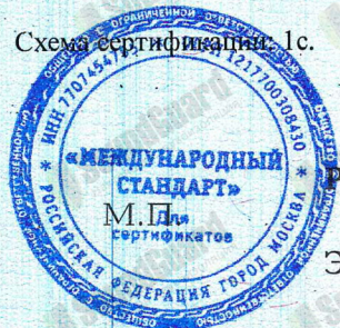
Схема сертификации - 1с.