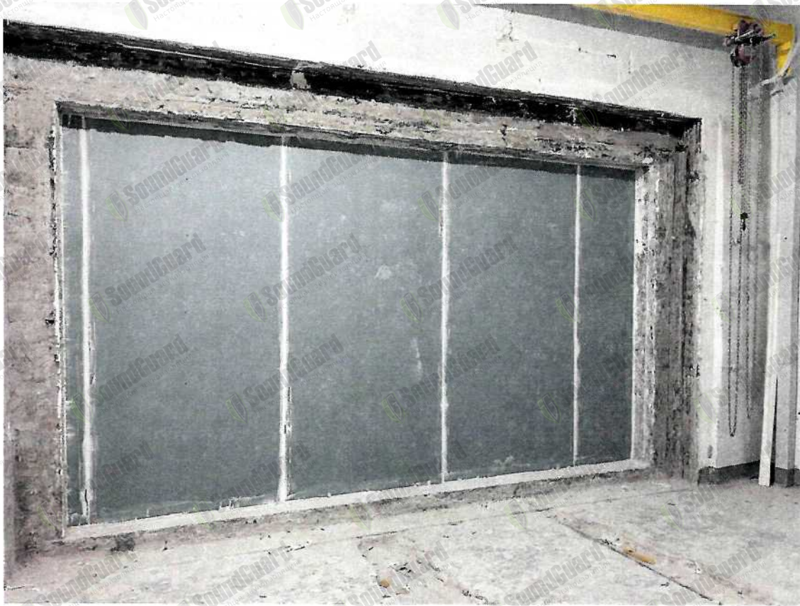
Фото. 1. Испытываемая конструкция со стороны камеры высокого уровня.