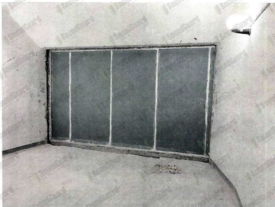
Фото. 2. Испытываемая конструкция со стороны камеры низкого уровня.