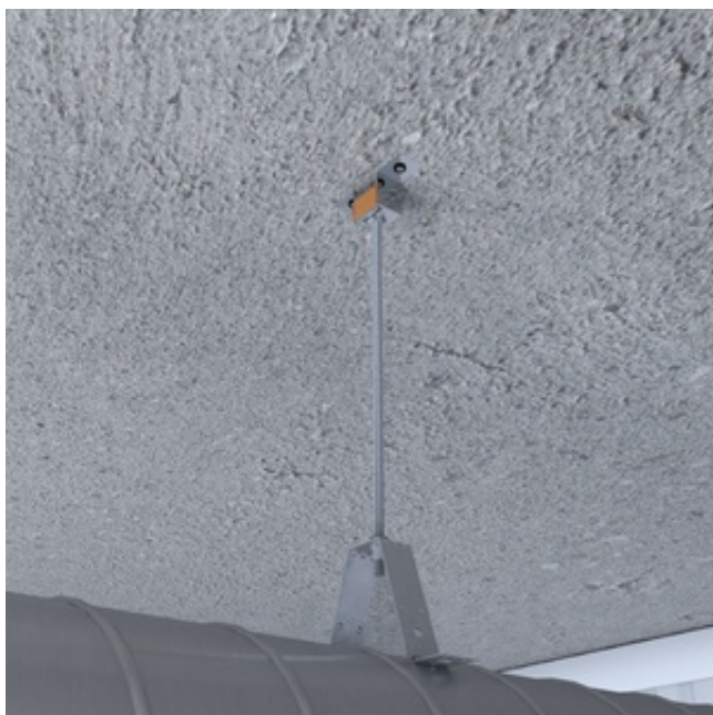
Крепление вентиляционной трубы к потолку с помощью виброподвеса BIS 8